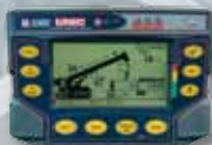
Indicatore di carico sicuro