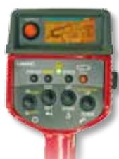
Radiocomando opzionale con visualizzazione digitale