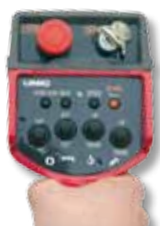
Radiocomando di serie