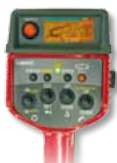
Radiocomando opzionale con visualizzazione digitale