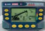
Indicatore di carico sicuro