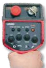
Radiocomando di serie